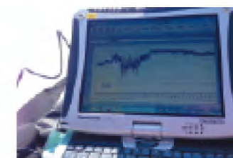
データ計測による客観的な分析