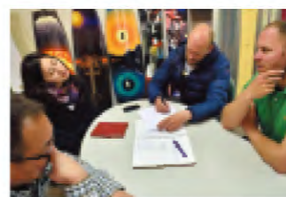
新型モデルについてのミーティング