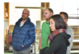
工場での製造方法の打ち合わせ